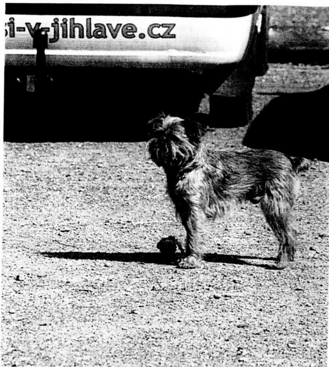
Dusty Pod pultem složil zkoušky ZOP. Majitel Vacková Pavla